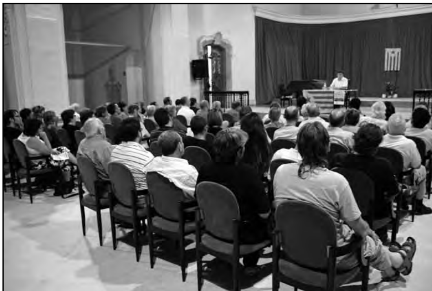
Aspecte que ofería l'auditori municipal.

Bertran va explicar que arran d'això i del veto de tots els partits polítics a la iniciativa popular primer, i a la iniciativa legislativa popular, després, perquè el parlament convoqués un referèndum oficial i vinculant sobre la