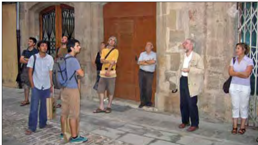
Els participants al curs, de visita per Cervera.